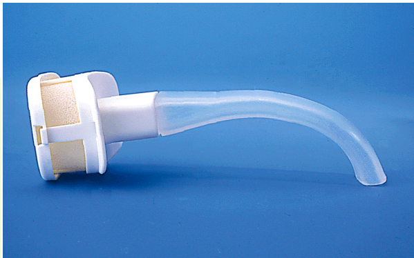
C.S.O. Canule souple oro-pharyngée